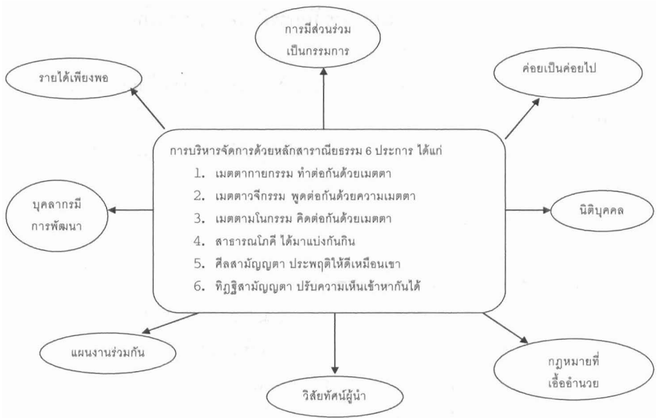
แผนภูมิที่ 2 รูปแบบของการบริหารจัดการโดยใช้หลักสราณีธรรม 6 ประการ

ผู้บริหารทั้งฝ่ายอบต. และฝ่ายสถานศึกษามีความเห็นพ้องต้องกันกับรูปแบบของการบริหารจัดการที่บูรณาการกับหลักสราณีธรรม 6 ประการ (พระราชมูณี, 2528) เพื่อการทำงานร่วมกันดังภาพข้างล่าง แผนภูมิที่ 2